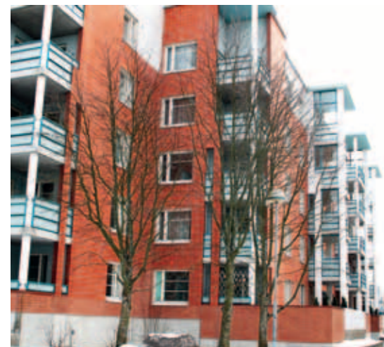
△ Laakavuorentie 7 on lähellä Mellunmäen metroasemaa. Sen asukkaista tulee auroranlinalaisia heinäkuun alussa.

Auroranlinna, joka jo nyt tuottaa toimitusjohtaja- ja isännöintipalvelut Helsingin Korkotukiasuntojen kohteisiin, valmistautuu parhaillaan valtuuston hyväksymän suunnitelman toteutukseen omalta osaltaan. □