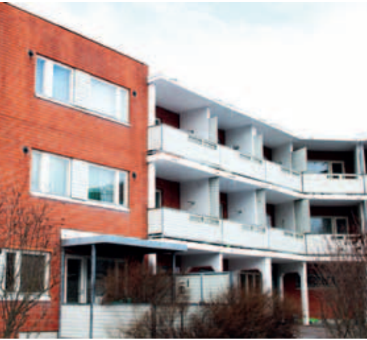
△ Julkisivuremontti, jonka takia kiinteistö joudutaan huputtamaan, on alkamassa Örskinkuja 2:ssa (kuvassa) ja Turkhaudantie 1:ssä Malmilla.

Vuonna 2019 eniten asumiseen häiriötä tuottavat remontit suunnitellaan tehtäväksi Turkhaudantiellä ja Örskinkujalla. Pihkatie 6:n ja Kaarlenkatu 3-5:n peruskorjaukset ovat suunnittelussa.